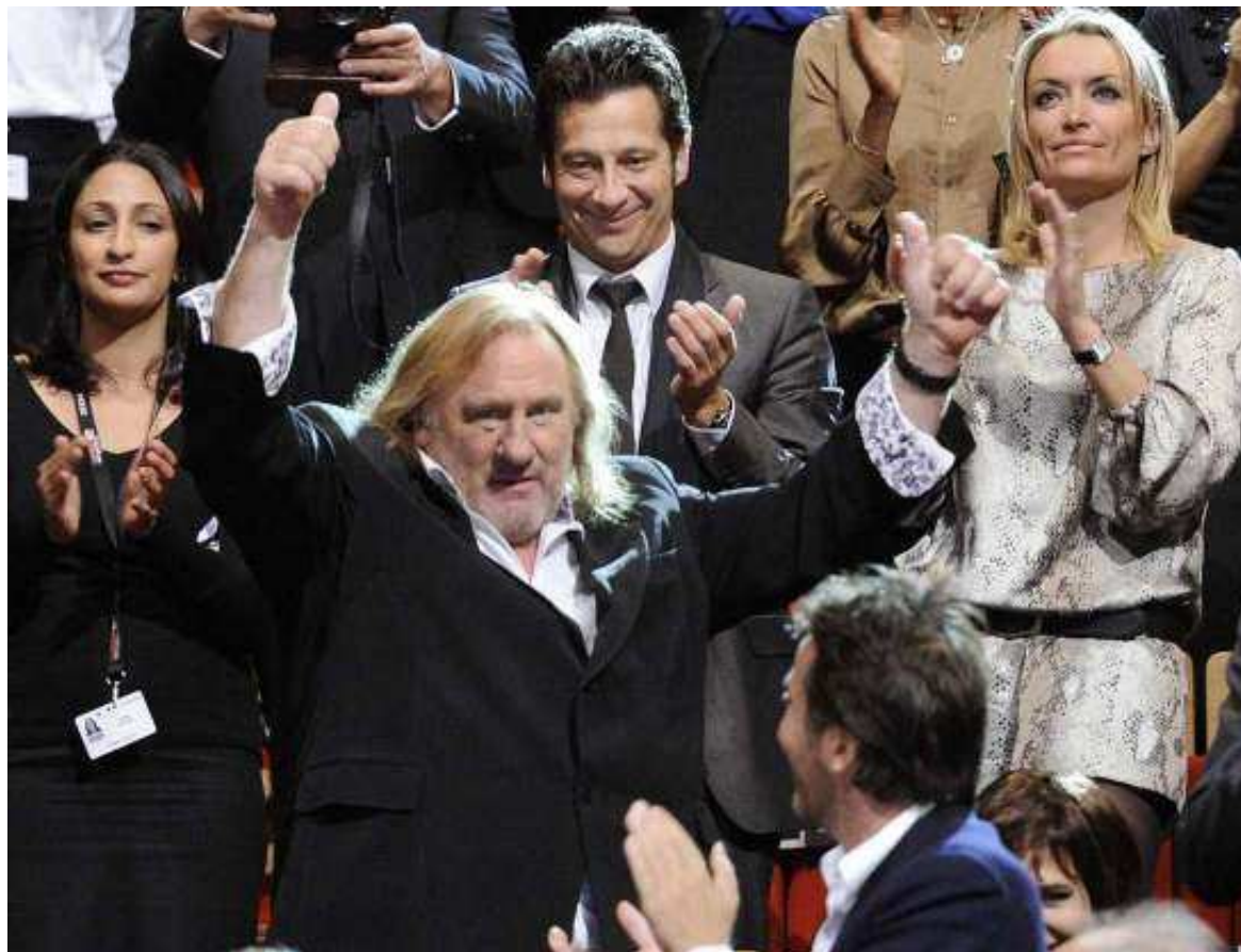
LYON (RHÔNE), HIER SOIR. Gérard Depardieu a reçu le prix Lumière. Laurent Gerra (au-dessus) et Edouard Baer (de dos) étaient venus applaudir ce monstre sacré du cinéma français.

GÉRARD DEPARDIEU. Oui, d'une certaine manière. Parce qu'ici il n'y a pas de compétition. Ce qui est beau dans ce festival Lumière, c'est l'amour du cinéma. Je n'aime pas spécialement les hommages, surtout ceux me concernant. Mais là, c'est émouvant que le public ait redécouvert des films